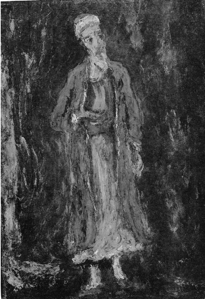
משה (אלעזר) קסטל (1991-1909), 'המקובל', 1933 (התצלום מתוך: משה קסטל: תערוכת יובל שישים שנות יצירה 1924-1984, במשכן הכנסת, ירושלים וקטלוג התערוכה), ראשון-לציון (1984)